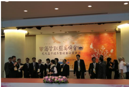
宣佈冠軍的同時，隊員們興奮擁抱。