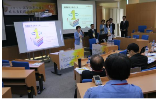
比賽現場各組使出渾身解數，盡力將個案分析 內容完整呈現。