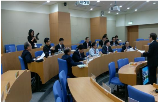
賽前進行評審會議，討論評分標準，確保評審 的公平性。