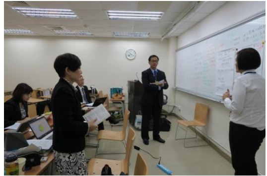
參賽隊伍在有限的 5.5 小時內要針對比賽題目 討論及進行簡報製作。