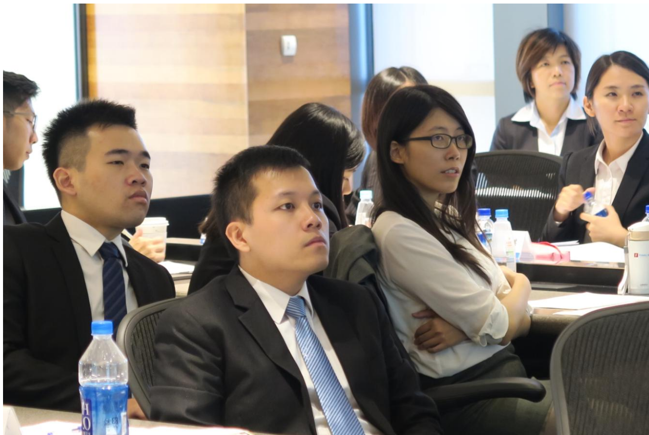
每位暑研生皆專心聆聽台上簡報，互相學習。