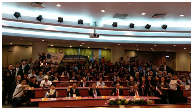
與會所有人員合影留念。