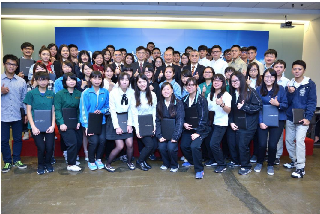
「元大清寒優秀獎學金」頒獎典禮於 12 月 2 日舉辦，首屆獲獎同學大合照。

元大文教基金會於 12 月 2 日舉辦首屆「元大清寒優秀人才獎學金」頒獎典禮，共有來自 14 所高中、8 所大專院校的 59 名優秀傑出學生獲獎，每人獲頒 20 萬元獎學金。