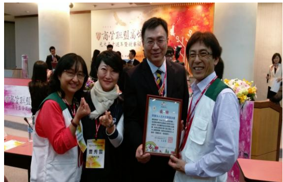
受贈之公益單位-家扶中心致贈感謝狀予本會。