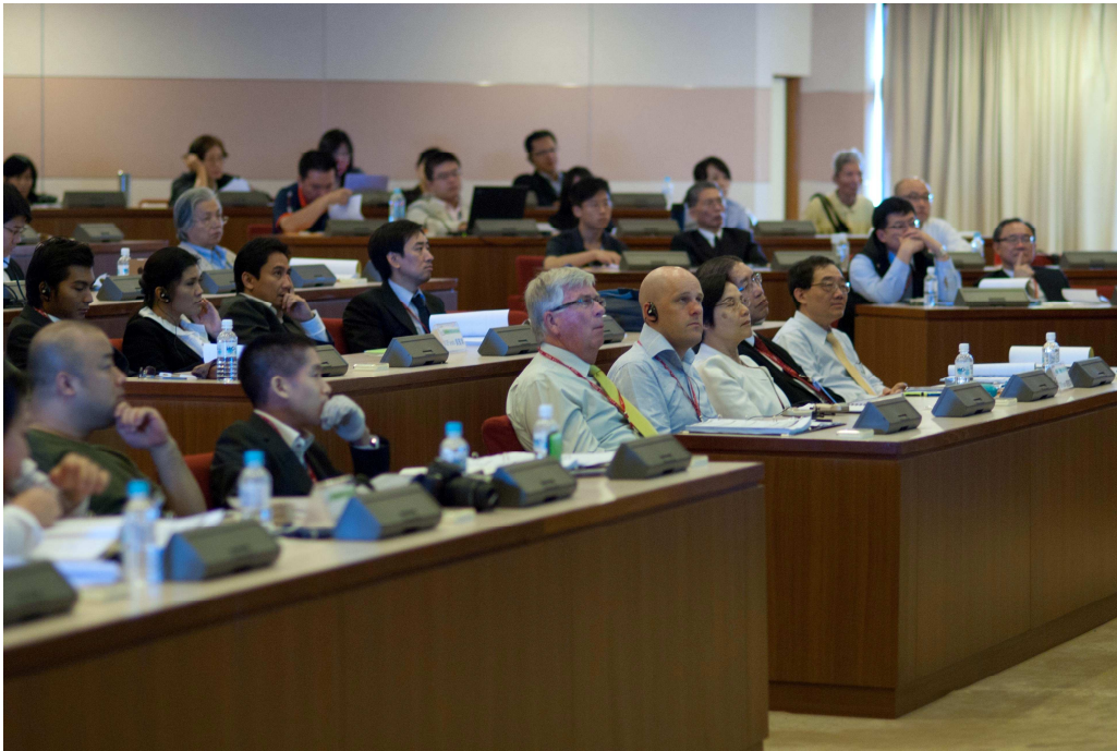
此次高峰會議共有 7 個國家、超過 30 位國內外家族企業經營者和學者與會分享家族企業經營與研究成果。